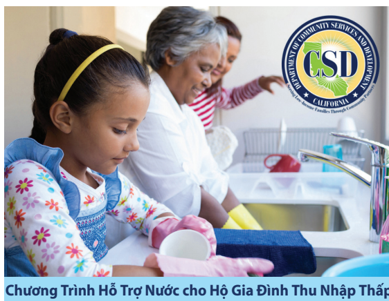
Chương Trình Hỗ Trợ Nước cho Hộ Gia Đình Thu Nhập Thấp

Chúng tôi chấp nhận thẻ tín dụng, thẻ ghi nợ và các hình thức thanh toán điện tử khác. Truy cập sjwater.com/customer-care/billing-payment để tìm hiểu thêm.