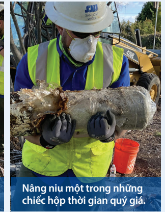
Nâng niu một trong những chiếc hộp thời gian quý giá.